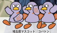
埼玉県マスコット「コバトン」

生産人口の減少によりますます激化する職員採用、そして法改正により急務となった生産性向上への対応について、明日から取り組める手法や実践的ヒントをお伝えするセミナーです。